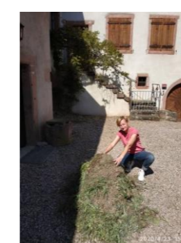
Débroussaillage cour chapelle