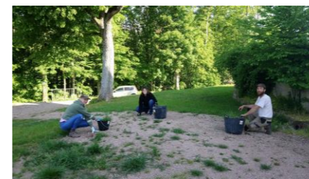
Débroussaillage St Gilles