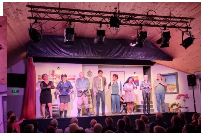
Une saison théâtrale unanimement appréciée !! P.10