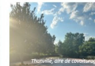
Thanvillé, aire de covoiturage