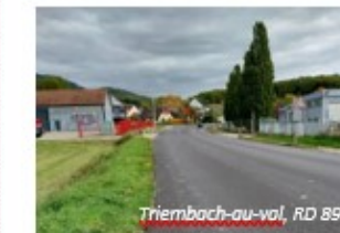
Triembach-au-Val, RD 897