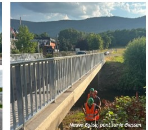
Neuve-Eglise, pont sur le Giessen