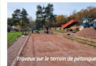
Travaux sur le terrain de pétanque